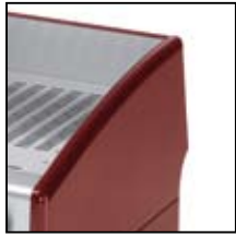
Rosso metallizzato Metallic red Rojo metalizado Rouge métallisé Rot metallisiert 金属红