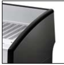
Nero metallizzato Metallic black Negro metalizado Noir métallisé Schwarz metallisiert 金属黑