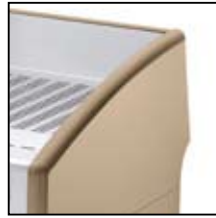
Sabbia Sand Arena Sable Sand 沙色 RAL 7048